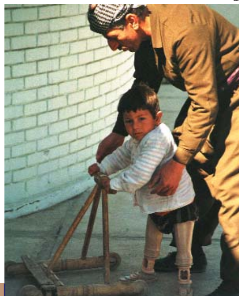
Roland Stähler / MKCK

Jednak... Większość ofiar min nie może liczyć na odpowiednią opiekę czy rehabilitację, gdyż żyją w krajach, gdzie opieka zdrowotna jest niewystarczająca, a placówki służby zdrowia często całkowicie zniszczone przez działania wojenne. Specyfika min przeciwpiechotnych powoduje że ich ofiary, oprócz natychmiastowej pomocy, polegać muszą na opiece zdrowotnej przez resztę swojego życia. Wciąż brakuje niezbędnych środków oraz wiedzy potrzebnej do oczyszczania terenów z min czy uświadamiania zagrożenia społeczności.