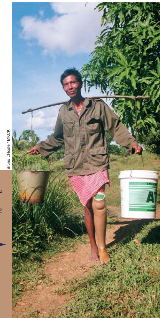
Bruno L'Heste / MKCK

Wspiera także państwa w przygotowaniach krajowego ustawodawstwa niezbędnego do wdrożenia Konwencji.