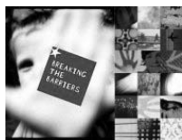
Logo konferencji - Breaking the Barriers/ Przełamując bariery

AIDS to poważny problem - w Polsce liczba zakażeń, choć stale rośnie, jest jeszcze pod kontrolą. Natomiast za naszą wschodnią granicą następuje eksplozja - w sąsiadującej Ukrainie liczba zakażeń wrosła 50-krotnie w ciągu ostatnich 8 lat, podobnie jak w Rosji czy Estonii. Może to się wydawać dziwne, ale to właśnie w naszym regionie epidemia HIV/AIDS rozprzestrzenia się najszybciej na świecie i aktualnie znajdujemy się w tym samym miejscu, w którym była Afryka 15 lat temu! 'Nasza' epidemia wyróżnia się jednak tym, iż prawie 70% nowych zakażeń występuje wśród młodych ludzi do 29 roku życia.