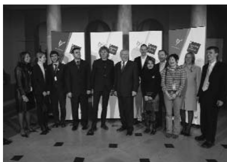
Przedstawiciele grupy młodzieżowej z Premierem Irlandii po środku

Filmy oraz wypowiedzi niektórych członków tej grupy młodzieży możecie znaleźć (jedynie po angielsku) w Internecie na stronie Prezydentury Unii Europejskiej: www.eu2004.ie (pod WEBCASTS 2004).